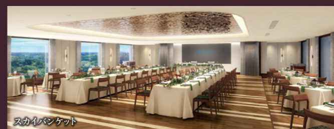
スカイバンケット

ホテル最上階のパーティー会場をはじめ、少人数から最大800名まで 収容可能な大小さまざまな会場で会議・研修・パーティー・式典など お客様の用途・目的に合わせてご利用いただける会場は順次、装いを新装します。